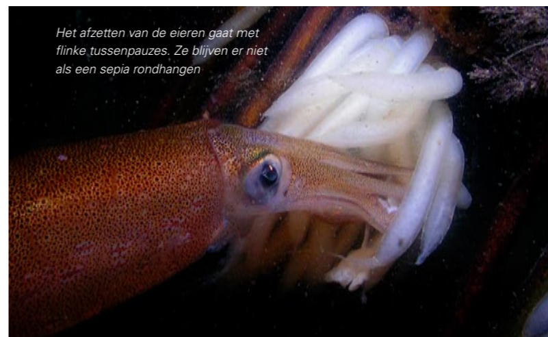
Het afzetten van de eieren gaat met flinke tussenpauzes. Ze blijven er niet als een sepia rondhangen