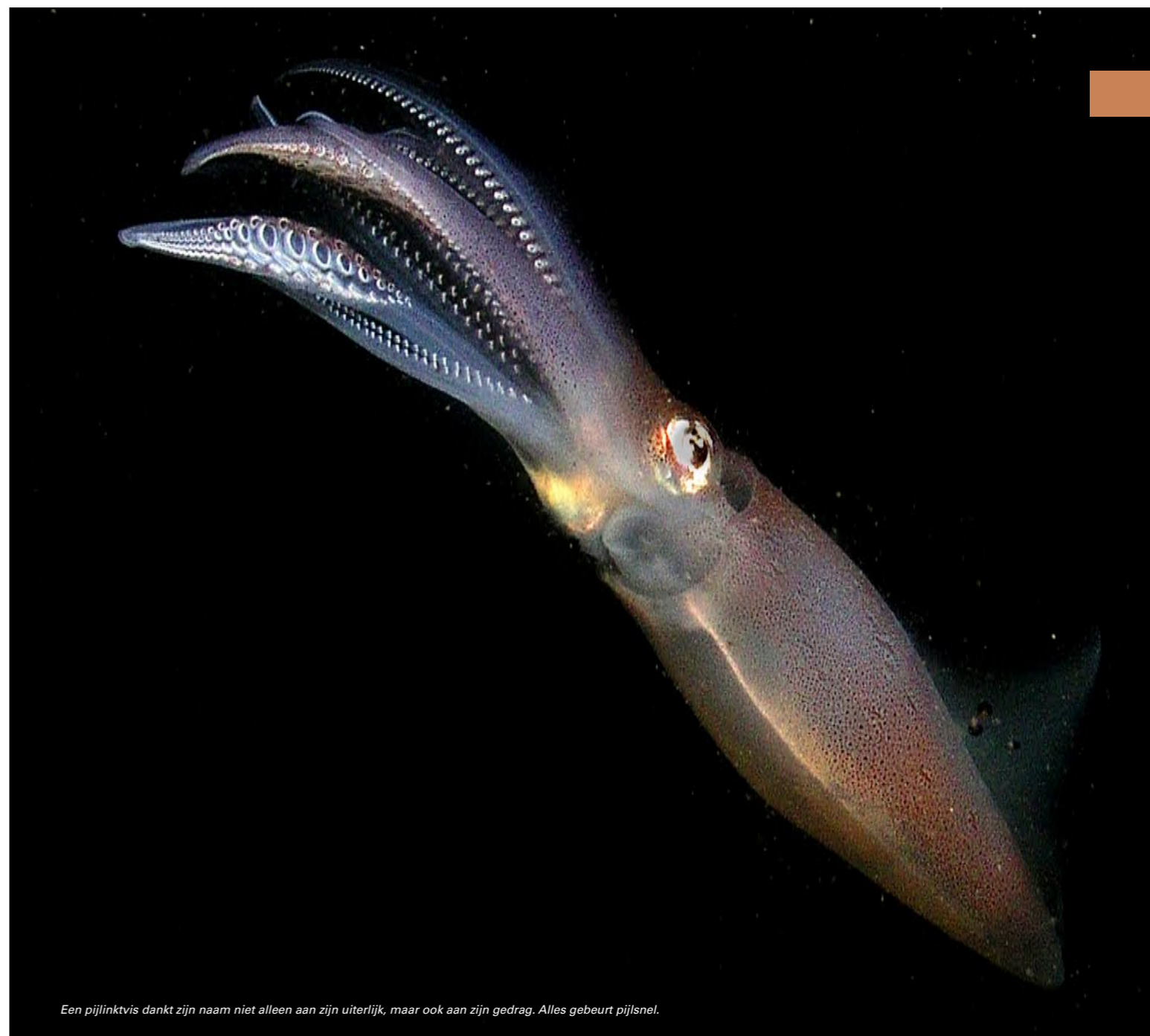
Een pijlinktvis dankt zijn naam niet alleen aan zijn uiterlijk, maar ook aan zijn gedrag. Alles gebeurt pijsnel.

daar een duidelijke foto van te maken, met flitslicht dat schuin van achter door de strengen heen moet flitsen. Dankzij die verwoede pogingen bleek op de laptop pas dat er een foto bij zat van een half uit het ei gekomen jonkie! Nu het augustus is, zien we bij het nachtduiken wolken met tientallen kleine pijlinktvisjes die gretig gebruikmaken van het lamplicht om het daardoor aangetrokken kleine gedierte af te vangen. Straks in oktober, wanneer ze ongeveer tien centimeter zijn en het water al weer flink is afgekoeld, zullen ze hun eerste grote reis naar het open water maken. Daar groeien ze verder op om na ongeveer drie jaar naar hun geboortewateren terug te keren.