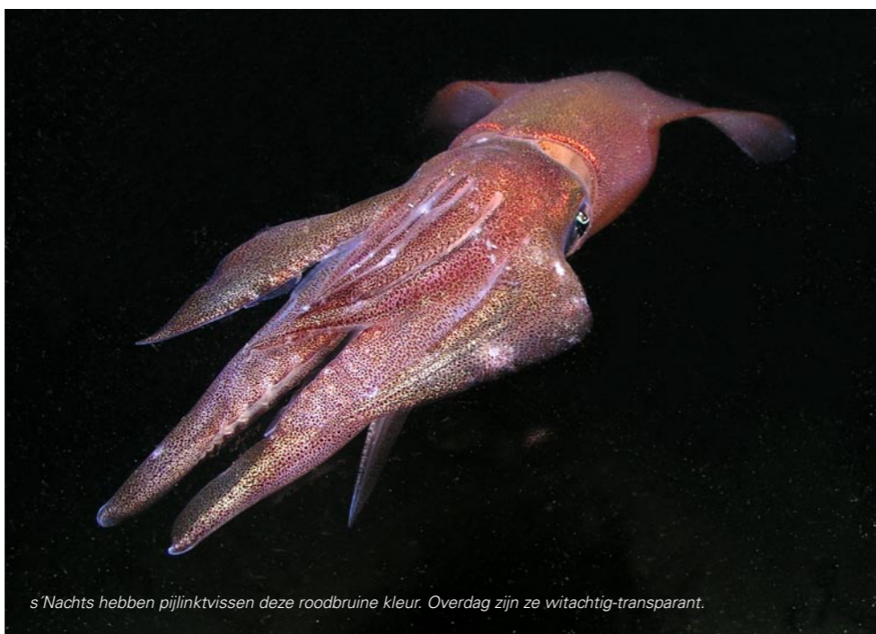
s'Nachts hebben pijlinktvissen deze roodbruine kleur. Overdag zijn ze witachtig-transparant.

Je kansen om ze te kunnen observeren zijn het grootst als je je houdt aan de volgende regels: geen sterke lamp, niet te snel heen en weer schijnen, niet rondzwemmen, maar rustig bij zo'n hutje met eieren blijven wachten. De beste tijd is de vooravond tot in de nachtelijke uren. Heel erg belangrijk is: weinig duikers. Een avondje door de week eropuit trekken loont zeker de moeite. Op een dag dat we de hutjes inspecteerden (op