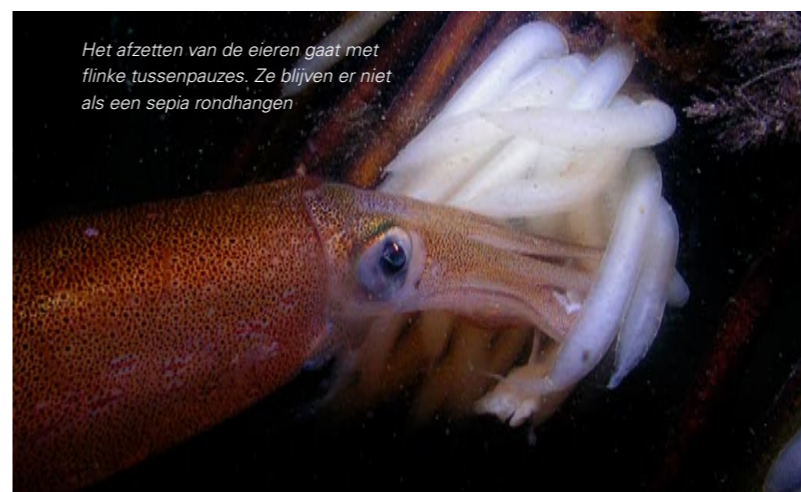
Het afzetten van de eieren gaat met flinke tussenpauzes. Ze blijven er niet als een sepia rondhangen